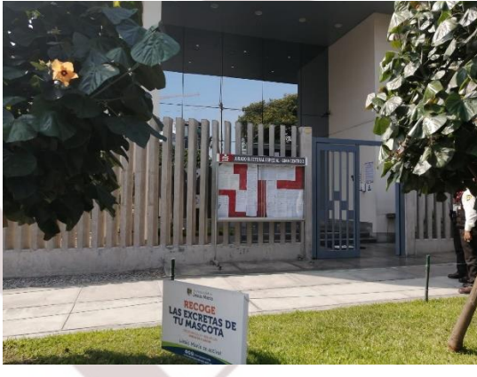
Foto 1: fachada JEE Lima Centro 2, alojado en el local JNE. Se aprecia el panel del JEE con la publicación del horario de atención.